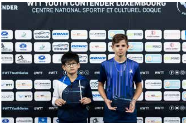
U13 Boys Singles