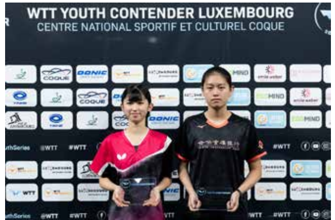
U19 Girls Singles