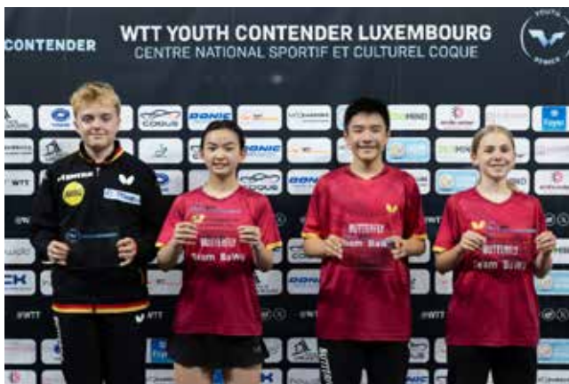
U15 Mixed Doubles