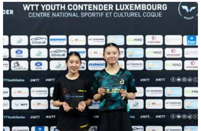
U13 Girls Singles