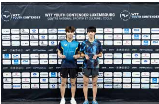
U17 Boys Singles