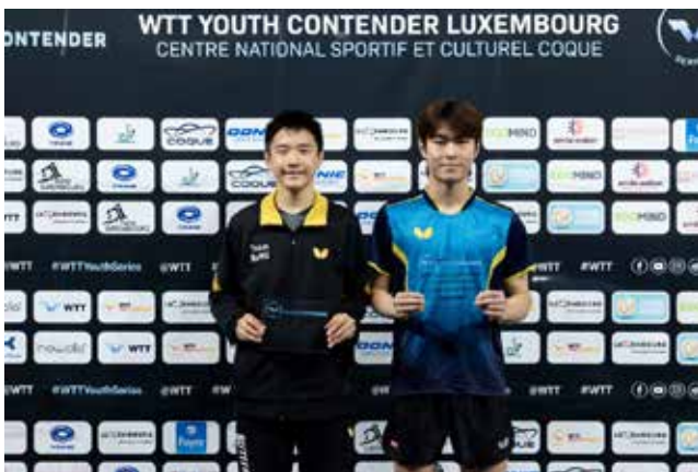
U15 Boys Singles