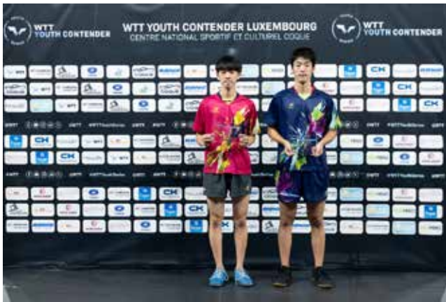
U19 Boys Singles