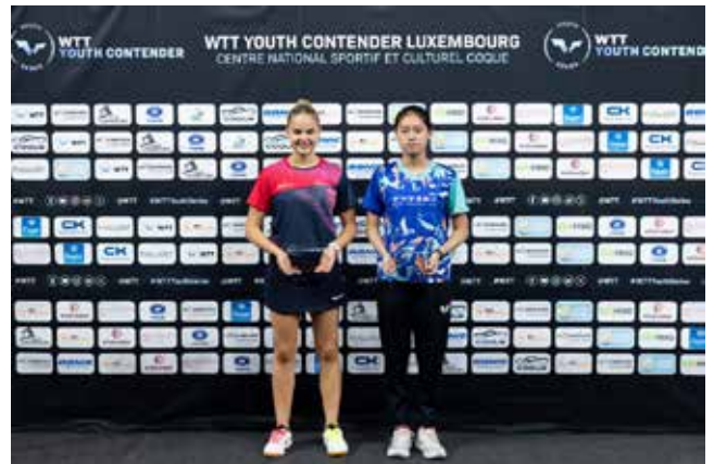
U17 Girls Singles