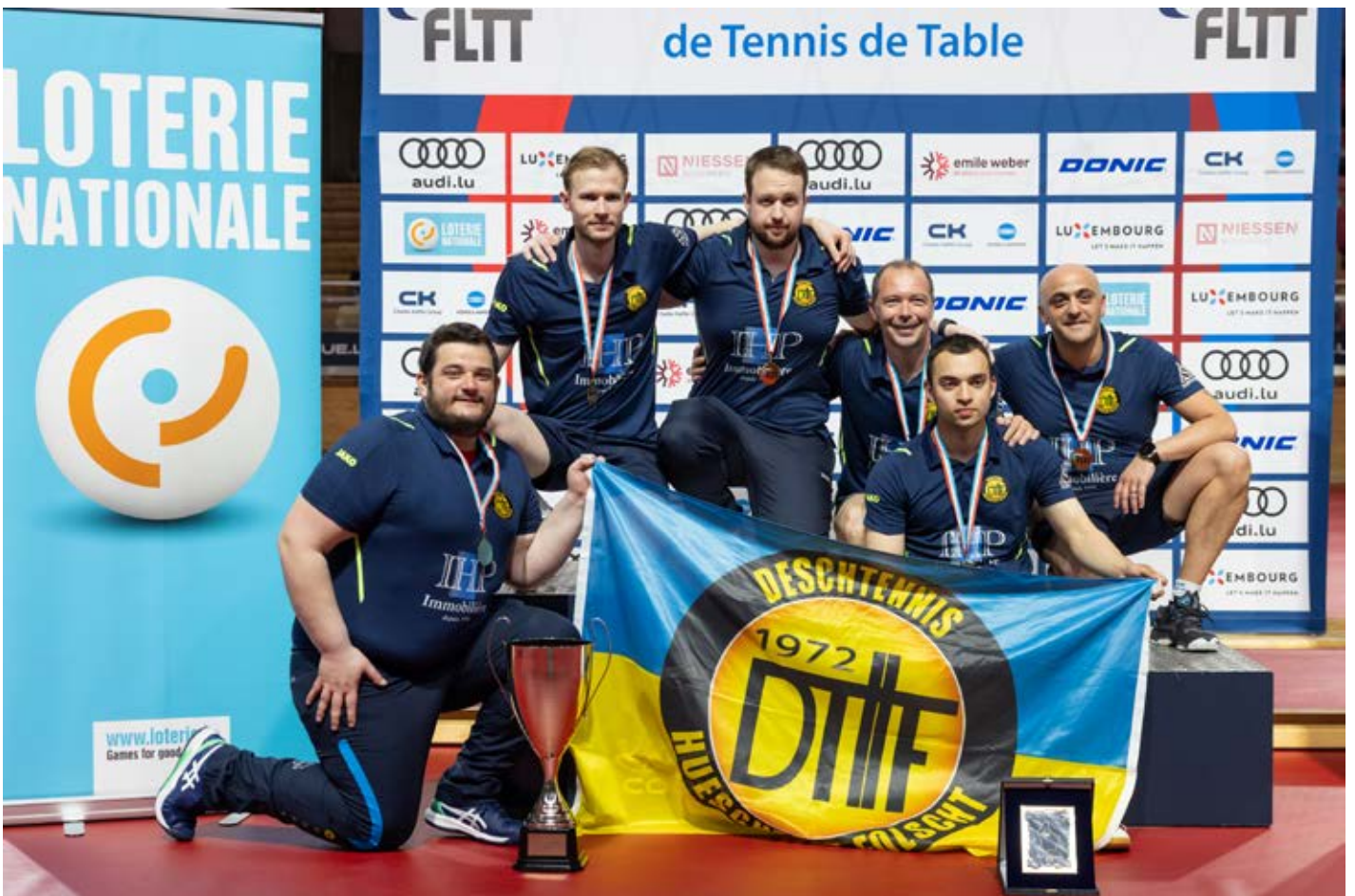
Die gesamte Fotogalerie befindet sich auf unserer Webseite.