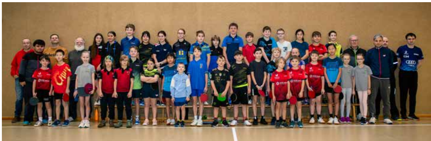
Regionallehrgang Lenningen 02.-03.01.2025