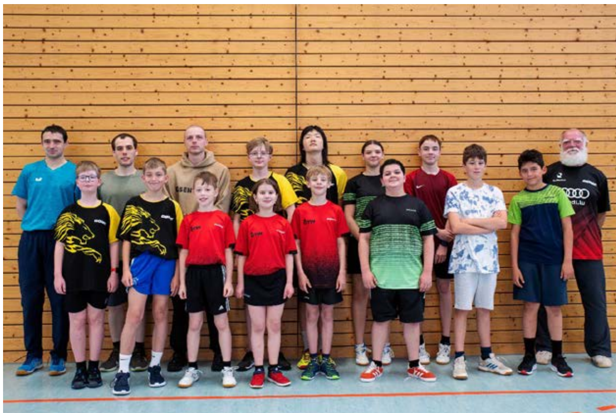
Photo des Regionallehrgangs Norden in Wilwerwiltz im Mai 2024