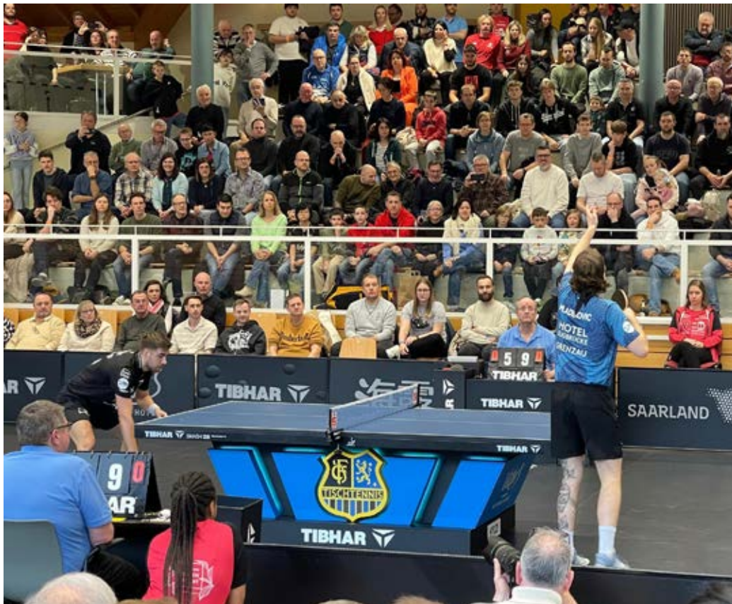
Ausverkaufte Halle in Berbuerg beim Bundesligaspiel von Saarbrücken gegen Grenzau

TTC Zugbrücke Grenzau - 1. FC Saarbrücken TT 2-3 Mladenovic Luka (DTTB 88) - Jorgic Darko (SLO, DTTB 7) 3-0 7, 5, 5 Mladenovic / Walker - Meissner / Ionescu 0-3 -14, -10, -6