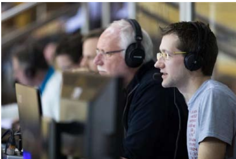
Premiere: Das Herren-Finale wurde am Sonntag ab 16.15 Uhr von livestreaming.lu übertragen. Co-Kommentator war Henri Dielissen.

Klare Verhältnisse wurden beim Finale des Teens-Cup von den Spielern von Lënster schnell geschaffen. Gegen Hueschtert-Folscht gab es ein glattes 4-0 und damit geht der Pokal wie vor zwei Jahren zum Fusionverein. Beim Kids-Cup waren die Talente von Houwald mit 4-2 zu stark für die Gegner von Lënster.