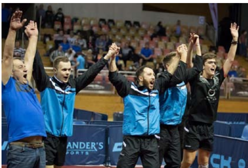
Überraschungssieger: DT Ettelbréck ließ sich nach dem 3-0 gegen Diddeleng feiern.

Ettelbréck hat beim „Loterie Nationale Cup Finals Day“ für eine große Überraschung gesorgt und im Finale der „Coupe de Luxembourg“ (Seniors) die Mannschaft des DT Diddeleng mit 3-0 geschlagen. Damit kassierte Diddeleng nicht nur die erste Niederlage auf nationalem Niveau in dieser Saison, sondern verpasste auch die Möglichkeit, den Landespokal zum fünften Mal in Folge nacheinander zu gewinnen. Für Ettelbréck war die Freude selbstverständlich riesengroß aus, als Luka Mladenovic gegen Christian Kill den Matchball zum 3-0 verwandelte.