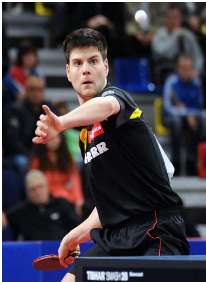
Auf Medaillenjagd für Deutschland: Europas Nummer 1, Dimitrij Ovtcharov