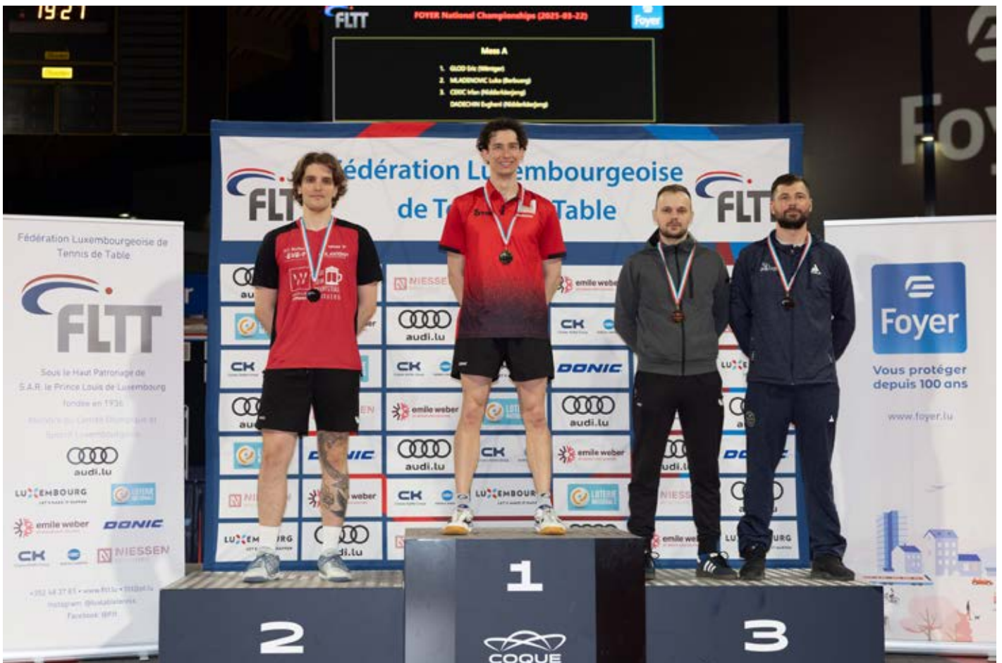
Die gesamte Fotogalerie befindet sich auf der Webseite.