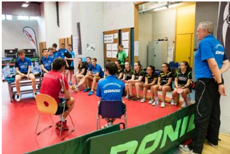
Mit einem Trainingslehrgang vor der Jugend-EM hat der „heiße TT-Sommer“ bereits in der ersten Juli-Woche begonnen.

Die Planung für die nächsten zwei Monate ist abgeschlossen. Daraus ist zu entnehmen, dass es in der Zeit, die