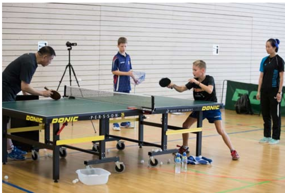
Von den besten lernen: Der renommierte Trainer Li Xiaodong im Einzeltraining mit einem niederländischen Talent.

Außerdem treffen sich die weltbesten Tischtennistalente zu zwei Lehrgängen im Rahmen des China Table Tennis College Europe (CTTC-E). In Zusammenarbeit mit dem Weltverband ITTF sowie der FLTT sind im I.N.S. vom 10. bis zum 18. August U13-Spieler der ganzen Welt mit ihren Trainern zum hochklassigen Lehrgang „2017 ITTF World Hopes Week & Challenge“ eingeladen. Vom 27. August bis zum 3. September werden während des „ETTU Development Camp“ die besten