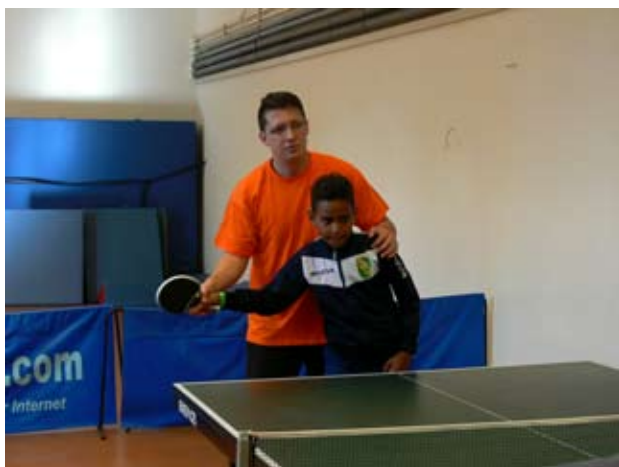
DT Esch Abol