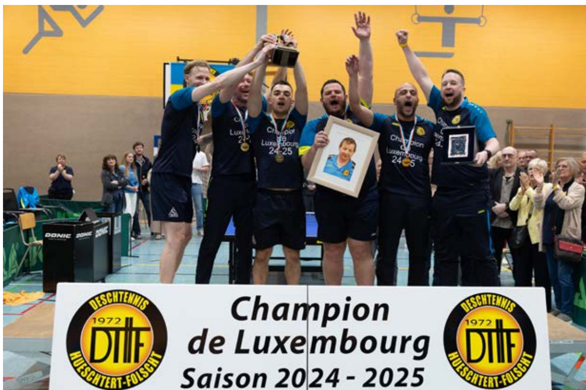
Foto: Claude Sibenaler. Die gesamte Fotogalerie befindet sich auf der Webseite der FLTT.

Dadurch kam es direkt am Anfang zum Spitzenspiel zwischen Van Dessel und Fuentes. Hier ging der Nationalspieler Van Dessel favorisiert ins Spiel, und er bestätigte seine Favoritenrolle mit einem deutlichen Dreisatzsieg. Am Nebentisch traf Shamruk auf Henkens und konnte die beiden ersten Durchgänge gewinnen, ehe sich der Berbuerger Henkens mit einem Sieg im dritten Satz zurückkämpfen konnte. Im vierten Durchgang konnte er beinahe den Entscheidungssatz erzwingen, doch Shamruk setzte sich schließlich knapp mit 12:10 durch, womit H-F – genau wie im Hinspiel - schnell mit 2-0 in Führung lag.