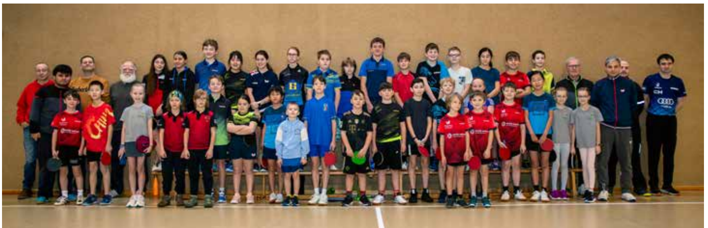
Regionallehrgang Lenningen 02.-03.01.2025