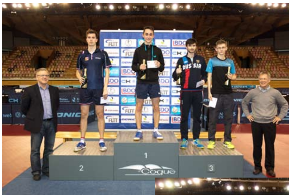
Siegerpodium der Herren: