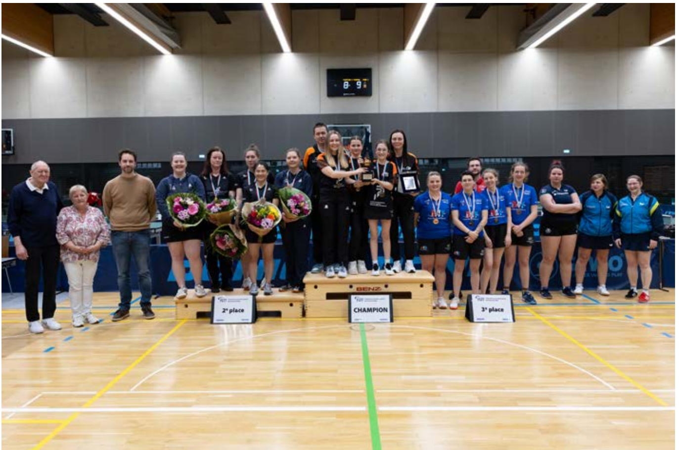
Die gesamte Fotogalerie befindet sich auf unserer Webseite