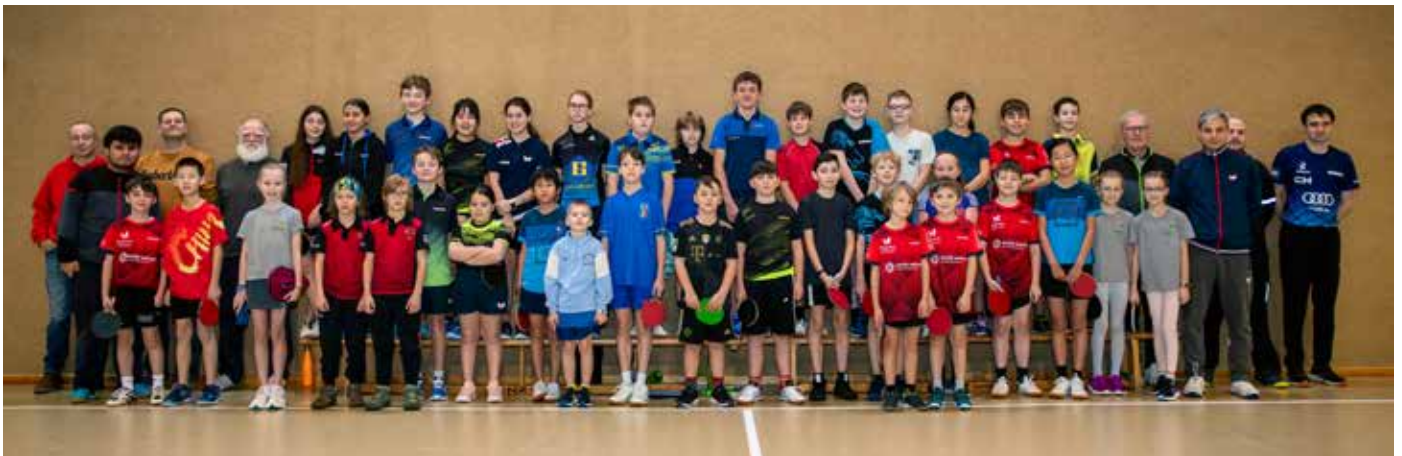
Regionallehrgang Lenningen 02.-03.01.2025