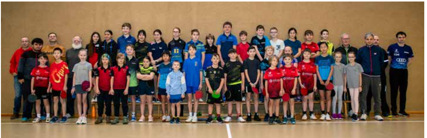
Regionallehrgang Lenningen 02.-03.01.2025