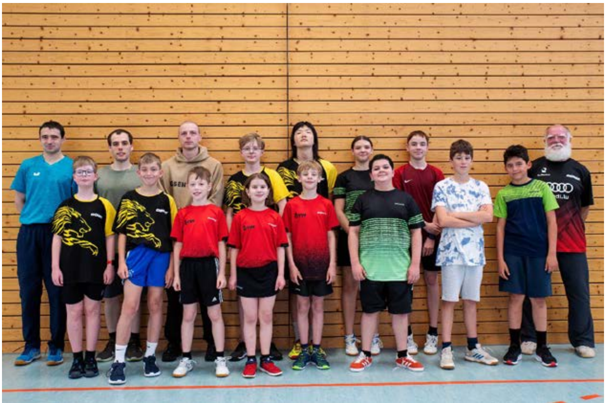
Photo des Regionallehrgangs Norden in Wilwerwiltz im Mai 2024